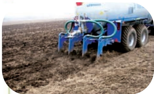
Doświadczenie z dygestatem z biogazowni