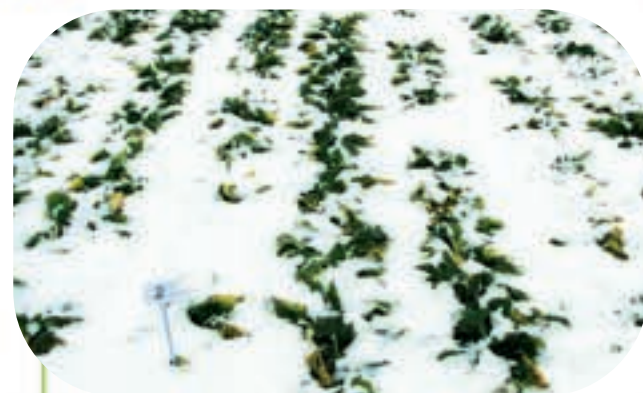
Doświadczenie z burakiem ozimym