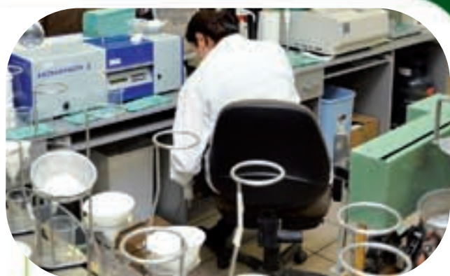
Laboratorium surowcowe i analiza