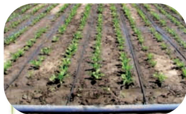
Doświadczenie z nawadnianiem