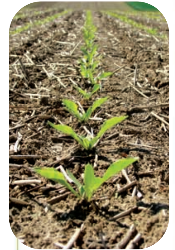
Doświadczenie z technikami uprawy