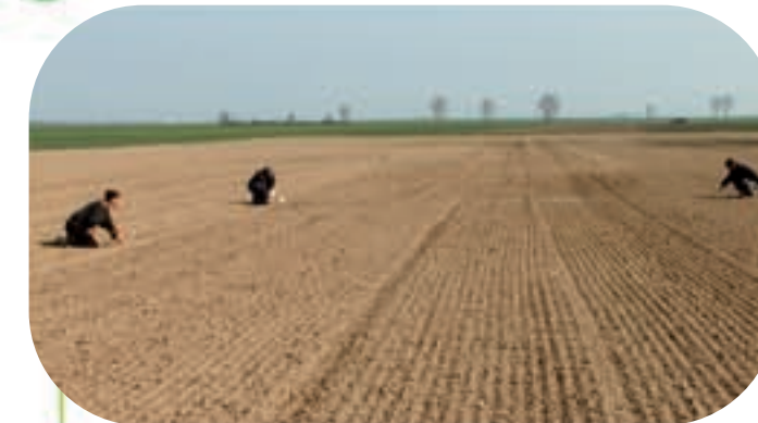
Wytyczanie powierzchni pola pod doświadczenia.